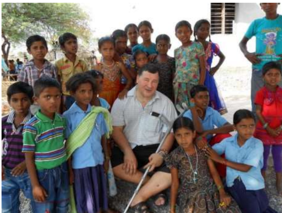
Obr. 12 Skupina dobrovoľníkov zo Slovenska a Čiech v indickom Manvi v rámci projektu Misia India